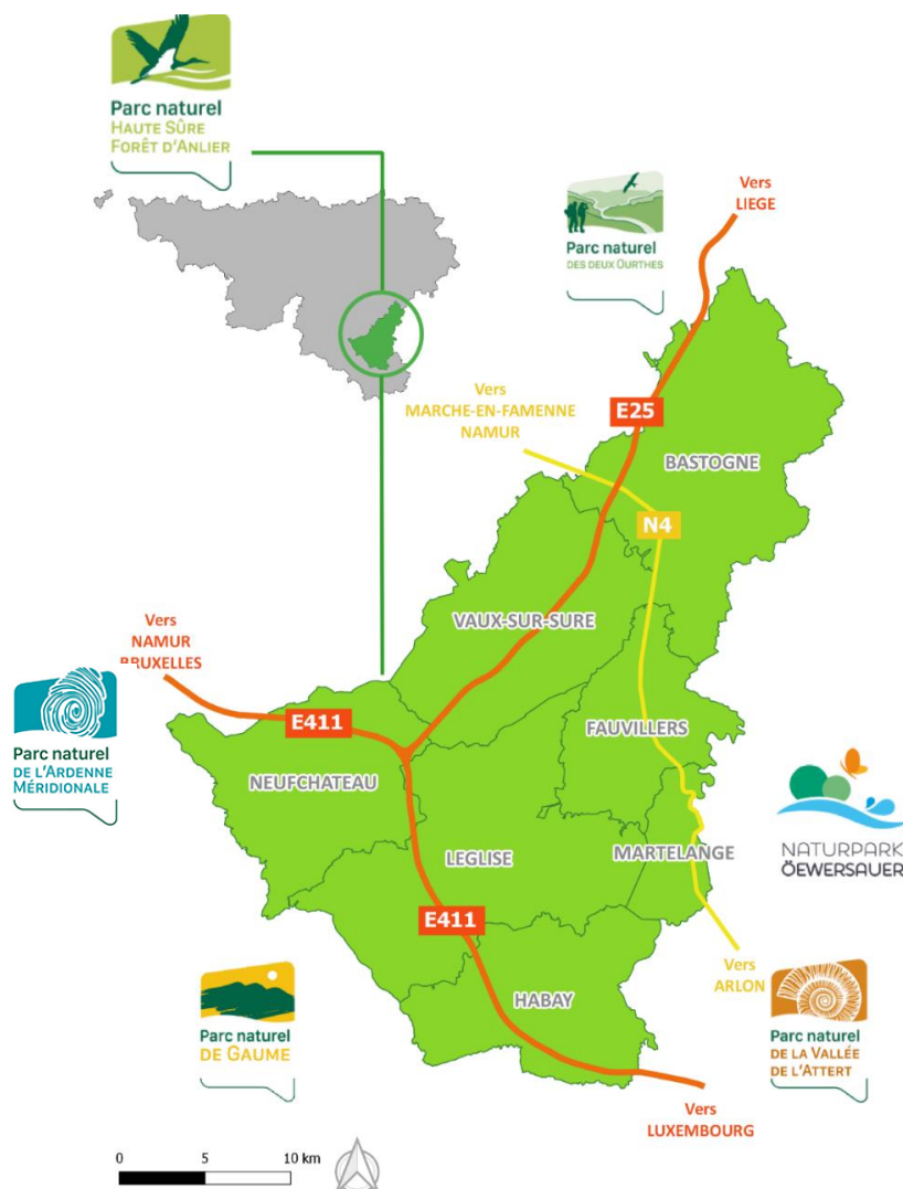
Fig. 1- Le Parc naturel Haute-Sûre Forêt d'Anlier

Le Parc naturel s'étend sur 80.200 ha, correspondant aux territoires des sept communes qui le composent, à savoir : Bastogne, Fauvillers, Habay, Léglise, Neufchâteau, Martelange et Vaux-sur-Sûre. De caractère essentiellement rural et de faible densité de population, la ville de Bastogne constitue l'entité la plus peuplée.